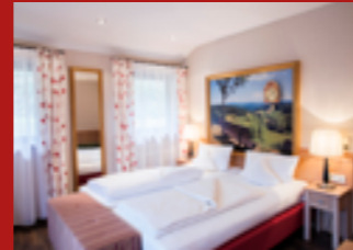
St. Peter Tal